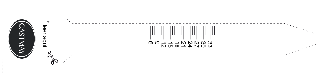
TABLA DE MEDIDAS